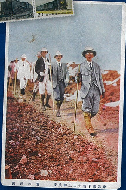
原河の築 安英御上山上高下殿宮東