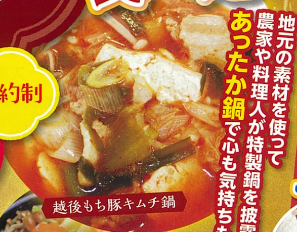
越後もち豚キムチ鍋

地元の素材を使って 農家や料理人が特製鍋を披露! あったか鍋で心も気持ちもほくほく!